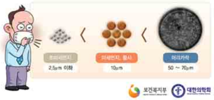
[미세먼지 입자 크기 비교]

미세먼지에 포함된 중금속, 유기탄화수소, 질산염, 황산염 등은 크기가 매우 작아 호흡기의 깊은 곳까지 도달이 가능하며 혈액을 통해 전신으로 순환하면서 우리 신체에 영향을 줄 수 있다.