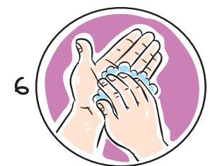
6 손가락을 반대편 손바닥에 놓고 문지르며 손톱 밑을 깨끗하게 합니다.