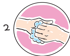
2 손바닥을 마주잡고 문질러줍니다.