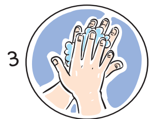
3 손바닥과 손등을 마주대고 문질러줍니다.