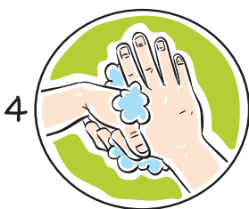
4 엄지손가락을 다른편 손바닥으로 돌려주면서 문질러줍니다.