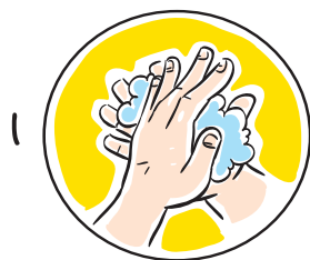
1 손바닥과 손바닥을 마주대고 문질러줍니다.